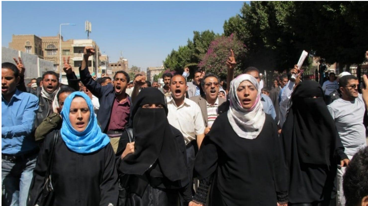
Figure 1 ทาวด์โคลด์ คาร์มาน (ด้านขวา ผู้คลุมผมสีเขียว) นักกิจกรรมชาวเยเมน ได้รับรางวัลโนเบลสาขาสันติภาพจากการรณรงค์สันติวิธีเพื่อสิทธิของผู้หญิง

โดย เอริก้า เซโนเวท และมาเรีย เจ สเตฟาน วันที่ 18 มกราคม 2016