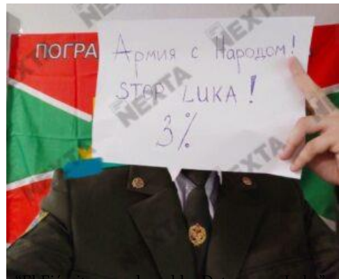
El Ejército con el pueblo. Detengan a Luka (es decir, Lukashenko, el líder de Bielorrusia desde hace mucho tiempo). “3%” se refiere a los resultados de encuestas informales sobre el apoyo a Lukashenko en el país.